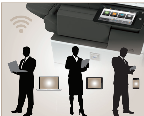
La interfaz de red inalámbrica incluida para el escaneo y la impresión desde dispositivos móviles.