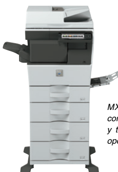
MX-B455W se muestra con un finalizador interno y tres bandejas de papel opcionales.