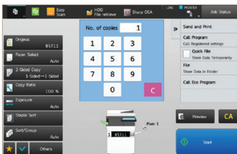
Con el botón de "detalles" tendrá acceso a las características avanzadas